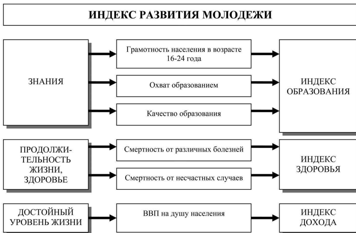
Рис. 1. Методология расчета индекса развития молодежи

Он рассчитывается на базе 3 групп показателей (см.рис.1.): индекса здоровья, индекса образования, индекса дохода.